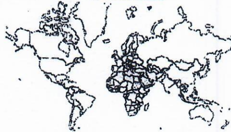
Arab Countries / Arab League Countries 2023