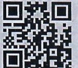
ماجد أبو سديرة